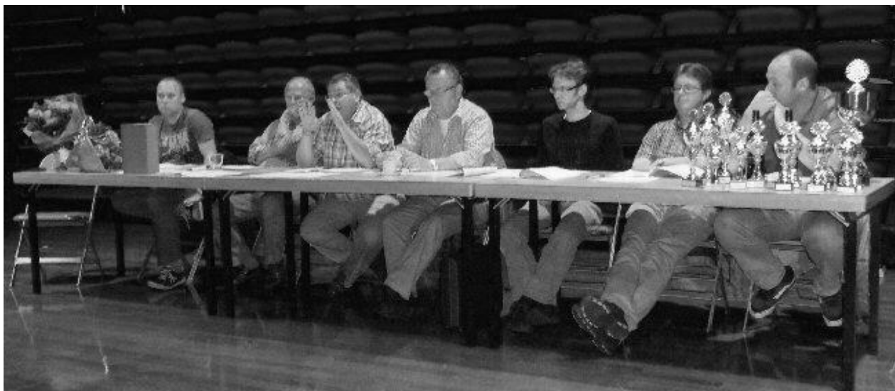
Het bestuur bestuurt